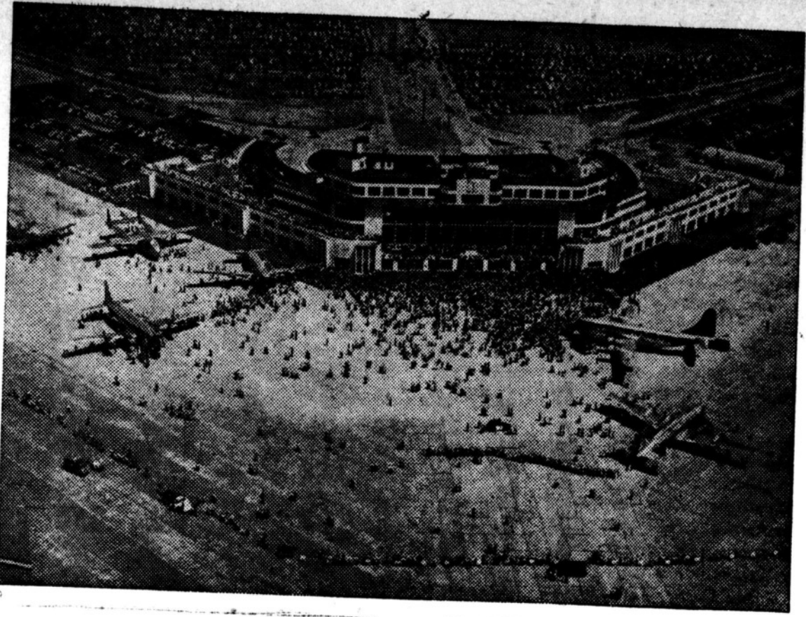
Stasiun udara internasional yang paling baru didunia, Pelabuhan Udara Internasional Seattle-Tacoma di Bow Lake, tengah djalan antara dua kota besar itu (Seattle dan Tacoma) dibagian barat dari Negara Washington, dipesisir Pasifik dari A.S., telah dibuka setjara resmi pada 9 Djuli 1949.

PENJELUDUPAN PERAK KENEGARA TABIR BESI. A.S. sibuk melakukan penjelidikan. Dari Toko "UP" kabarkan, markas besar Serikat di Djepang telah memerintahkan penjelidikan resmi terhadap kebenaannya berita2 yang menjatakan segerombolan sabutar Amerika dengan tjara rahasia telah menjual perak Djepang kepada negara2 dibelakang Tirai Besi. Penjelidikan ini mengenai tiga buah kontrak, dalam mana kira2 4000 ton perak electrolyt sehingga sedjuta pondsterling telah dibeli di Djepang, dengan tudjuan dibawa ke Nederland, Belgia dan Perantjis.